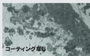
コーティングなし