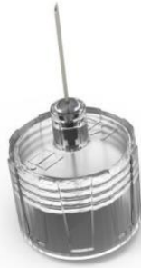
Braunform의 기술을 사용하여 생산된 루어 잠금 커넥터 (개조된 바늘이 사용된 이미지)