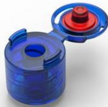
Braunform의 4+4 캐비티 사출 금형 제품 샘플: 뚜껑이 있는 루어 커넥터 / 이미지 출처: Braunform