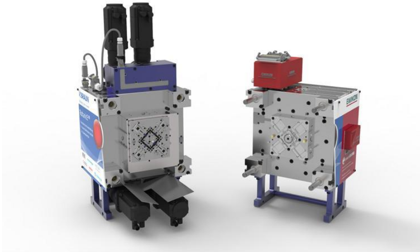
소형화 및 효율성의 대표적인 예: Braunform의 특허 받은 RotaricE 2 ® 사출 금형 기술로 생산된 루어 커넥터 (4+4 사출 금형 형태의 이미지)

제약 산업에서 사출 금형은 최대 15년까지 안정적으로 사용할 수 있어야 하며 그 수는 수천만 개에 이릅니다. 때로는 교체나 확장이 필요한 경우도 있는데, 이는 기존의 금형과 100% 동일해야 합니다. 이러한 배경에서 Braunform은 연간 100~130개의 금형을 생산하며 업계 최고의 수준을 유지하고 있습니다. 이것이 바로 RotaricE 2 ®이 의미하는 바이며 올리콘이 표면 솔루션을 통해 상징하고자 하는 것입니다.