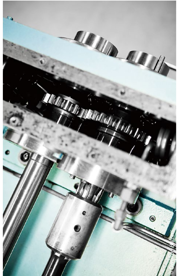
Im Werkzeugmaschinenlabor der RWTH Aachen fanden am FZG-Verzahnungsprüfstand die Pittingtests statt

Für die Versuche wurden Ritzel und Rad (16MnCr5E, FZG-C mod Geometrie) in unterschiedlichen Kombinationen geschliffen, strukturiert beziehungsweise beschichtet (Bild 2). Teilweise wurde dabei eine Kohlenstoffbeschichtung (a-C:H:Me) eingesetzt: Balinit C (WC/C) von Oerlikon Balzers. Diese Schicht bewährt sich seit langem zum Beispiel in schnell oder langsam laufenden Getrieben und verbessert hier die Notlauf Eigenschaften, wenn der Schmierfilm abreißt. Entsprechende Anwendungsbereiche sind Luftfahrt, Windkraft sowie der allgemeine Maschinenbau.