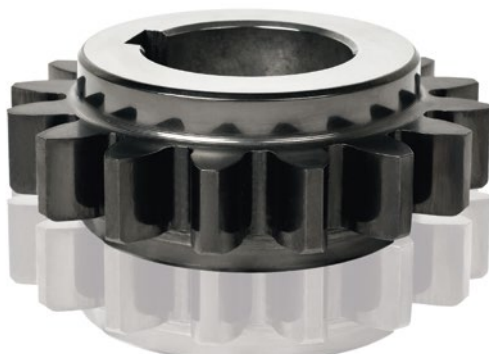
Bild 3: Das Ritzel aus Test 4 mit Gleitschliff und Kohlenstoffbeschichtung

Am Pulsator-Prüfstand, mit dem die Zahnfußfestigkeit ermittelt wurde, ließ sich Bemerkenswertes feststellen: Die einzelnen Test-Kombinationen von Beschichtung und sämtlichen Vorbehandlungen haben die Zahnfußfestigkeit nicht negativ beeinflusst. Damit haben sich Ergebnisse aus früheren vergleichbaren Tests (zum Beispiel FVA 393) nicht bestätigt. Damals lagen die Beschichtungstemperaturen prozessbedingt bei über 180 °C. Eine wichtige Vorbedingung für die Beschichtung von Bauteilen lautet jedoch: Die Beschichtungstemperatur muss stets kleiner sein als die Anlasstemperatur des Grundmaterials, die bei Zahnrädern im Bereich von 160 °C bis 180 °C liegt. Dies wurde bei der neuerlichen Versuchsreihe beachtet und somit die Zahnfußfestigkeit nicht beeinträchtigt.