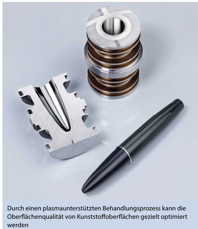
Durch einen plasmaunterstützten Behandlungsprozess kann die Oberflächenqualität von Kunststoffoberflächen gezielt optimiert werden

Dies wird erreicht durch die Diffusionsbehandlung Primeform von Oerlikon Balzers. Eine Schicht mit gradierter Oberflächenhärte schützt vor Verschleiß und reduziert Beläge, um die Formreinigung deutlich zu erleichtern. Sichtbare Fehlstellen in den Kunststoffteilen können ausgeschlossen werden, da weder Abplatzungen noch Versprödungen der Schicht auftreten.